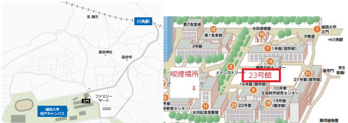
坂戸キャンパスまでの所要時間

城西大学坂戸キャンパス（埼玉県坂戸市けやき台1-1） 東武越生（おごせ）線川角（かわかど）駅より徒歩10分